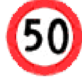
AZAMİ HIZ SINIRI