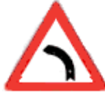
SOLA TEHLİKELİ VİRAJ