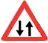
İKİ YÖNLÜ TRAFİK