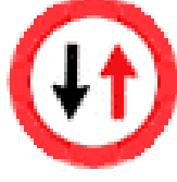
KARŞIDAN GELELE YOL VER