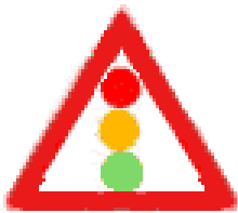
İŞIKLI İŞARET CİHAZI