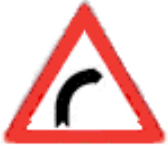
SAĞA TEHLİKELİ VİRAJ